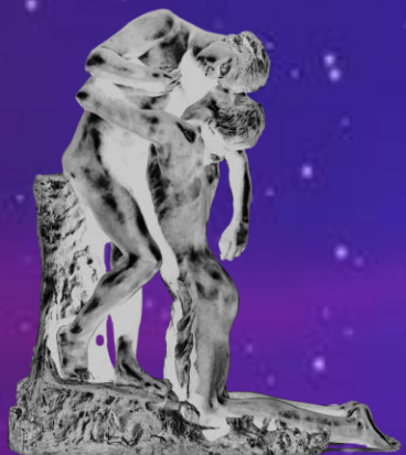
L'ABANDON, CAMILLE CLAUDEL