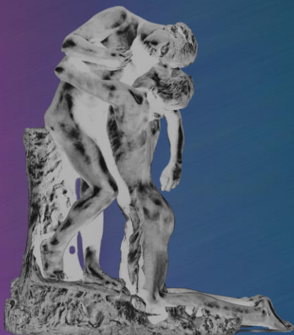
L'ABANDON, CAMILLE CLAUDEL